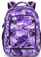
323-54 Purple Rose