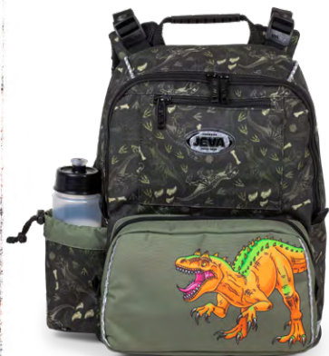
403-23 START-UP Camou Dino

START-UP er vores nyeste model til skolestart – den vejer kun 800 gram, sidder perfekt, er super funktionel og drønsmart, og så er den inklusiv drikkedunk, gymnastikpose og et stort isoleret madkasserum.