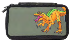
8865-23 TWOZIP Camou Dino