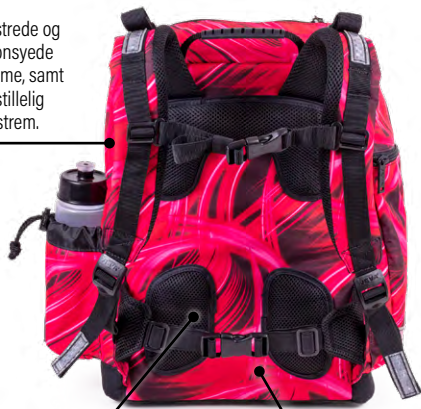
Pink Lightning U-TURN 401-96

Polstrede og faconsyede remme, samt indstillelig brystrem.