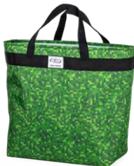
113-07 Pixel Rex

Den mest bæredygtige variant af JEVA's HOLD-ALL får du, når du køber "HOLD-ALL - Made in Denmark". Syet i Danmark af overskydende metervarer fra vores øvrige produktion.