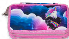
8865-22 TWOZIP Unicorn Heaven