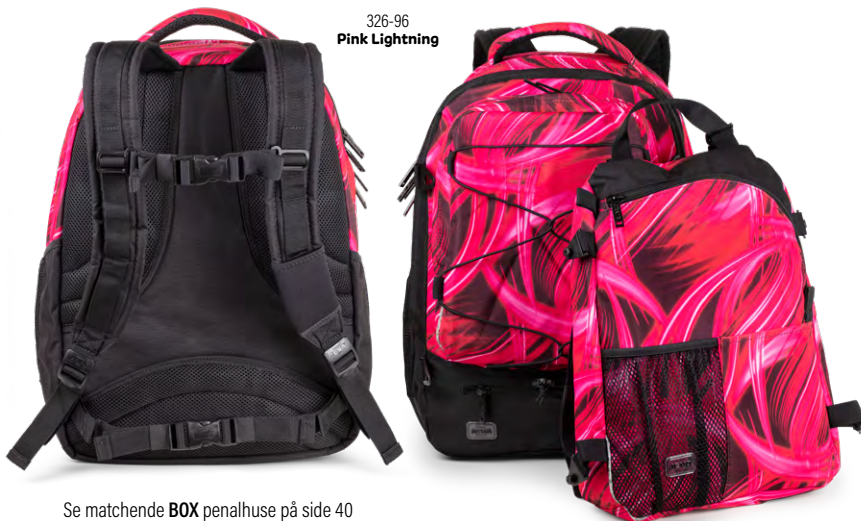
326-96 Pink Lightning