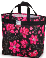
113-62 Virtual Pink