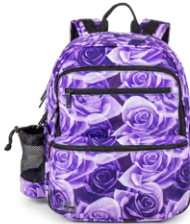
324-54 Purple Rose