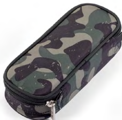
351-41 Green Camou