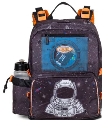
403-27 START-UP Space