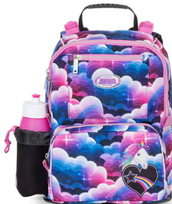
403-22 START-UP Unicorn Heaven