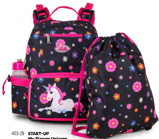
403-28 START-UP My Flower Unicorn