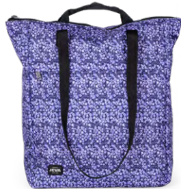
112-92 Purple Pequena