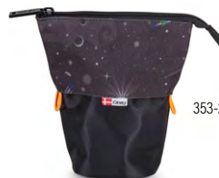
353-27 SNAP Space