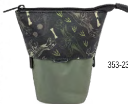
353-23 SNAP Camou Dino