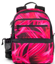
324-96 Pink Lightning