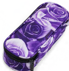
351-54 Purple Rose