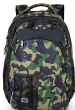
326-41 Green Camou