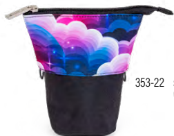
353-22 SNAP Unicorn Heaven