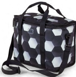
Football Striker 114-13