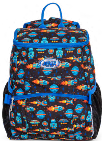
274-55 Space Games

Scan QR koden og se mere information samt video om skoletaskens indretning. Se også farverne fra tidligere kollektioner.