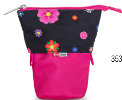
353-28 SNAP My Flower Unicorn