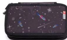
8865-27 TWOZIP Space