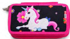
8865-28 TWOZIP My Flower Unicorn

OBS: På side 30 finder du beskrivelse af vores penalhuse.