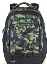
323-41 Green Camou