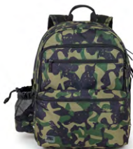
324-41 Green Camou