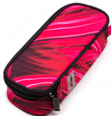
351-96 Pink Lightning