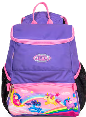
274-56 Rainbow Friends