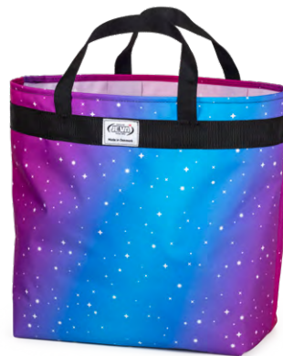
113-04 Rainbow Alicorn