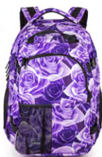
326-54 Purple Rose

Pssst ... SUPREME er også perfekt på rejsen; du har altid 2 rygsække med dig: 30 + 10 liter