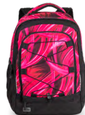
323-96 Pink Lightning