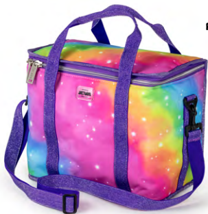
Rainbow Alicorn 114-18

JEVAs smarte køletaske sørger for, at din madpakke, dine snacks og drikkevarer er kølige i lang tid. Køletasken er fuldt isoleret, og vandtæt, så du også kan have den med på ture ud i naturen. Metervaren, vi anvender til produktionen af vores køletasker, er overskudsmetervarer fra vores produktion af skoletasker – på denne måde undgår vi ressourcepild.